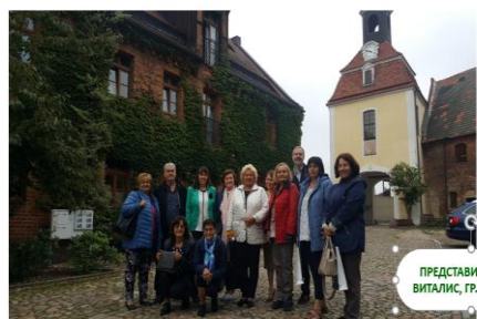
ПРЕДСТАВИТЕЛСТВО ВИТАЛИС, ГР. ЛАЙПЦИГ

Изрази увереност, че реализираното партньорство и осъществяването на проекта ще допринесат за разширяване на европейската интеграция на училището, за придобиване и обогатяване на опита при работа с европейски партньори за практическо обучение на учениците от гимназията в интернационална работна среда.