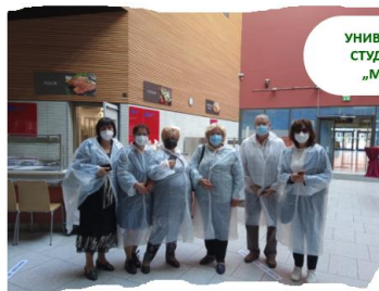
УНИВЕРСИТЕТ ЛАЙПЦИГ СТУДЕНТСКА СТОЛОВА „МЕНЗА АМ ПАРК“