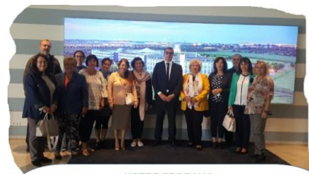
ХОТЕЛ ГЛОБАНА гр. Шкойдиц