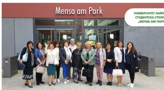
УНИВЕРСИТЕТ ЛАЙПЦИГ СТУДЕНТСКА СТОЛОВА „МЕНЗА АМ ПАРК“