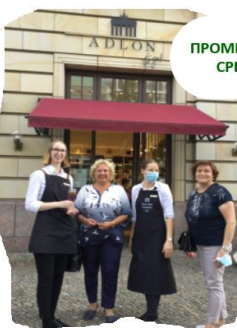
ПРОМИНЕНТЕН ХОТЕЛ АДЛОН СРЕЩА СЪС СТАЖАНТИ