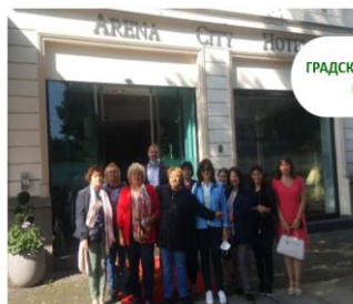
ГРАДСКИ ХОТЕЛ АРЕНА гр. Лайпциг