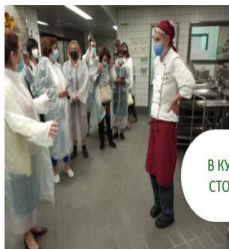
В КУХНЯТА НА СТУДЕНТСКАТА СТОЛОВА С ГЛАВНИЯ ГОТВАЧ